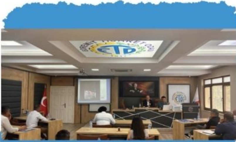
ETO'da Termal Turizm Sektör Toplantısı Yapıldı