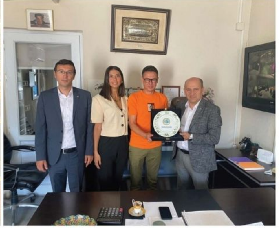
Şık Süt-Süt Ürünleri