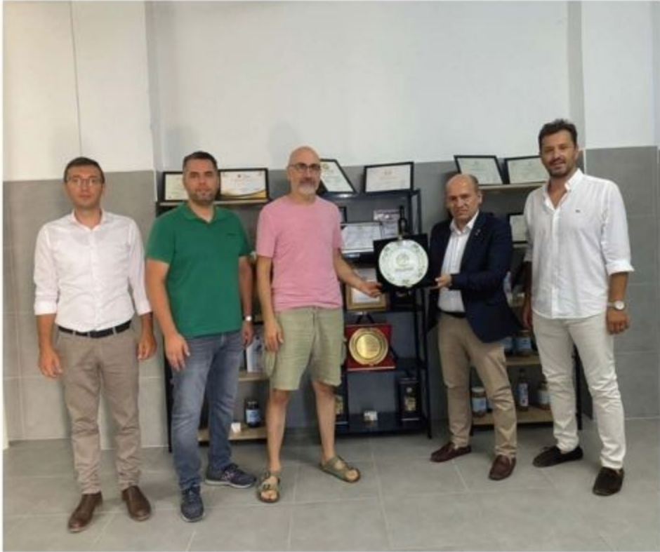
By TEO Zeytinyağı