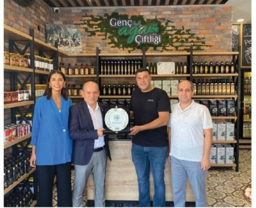
Genç Ağa Çiftliği