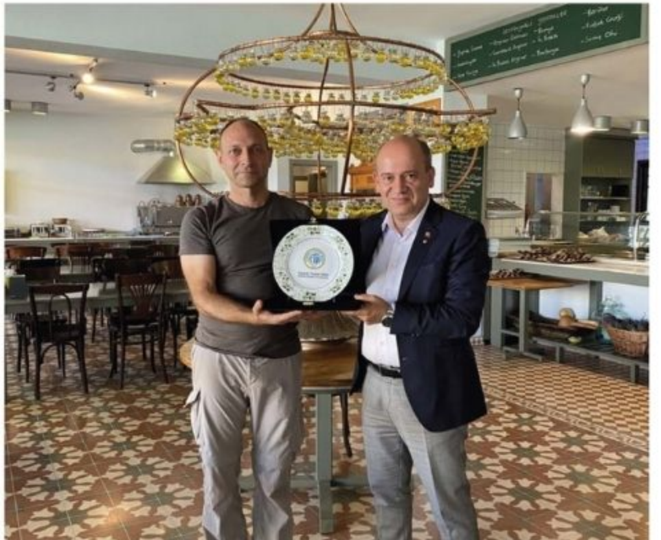
Laleli Zeytin Zeytinyağı