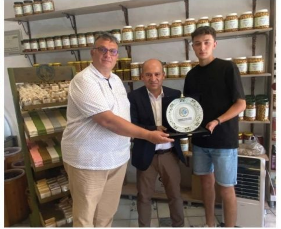
Harmantepe Zeytin Zeytinyağı