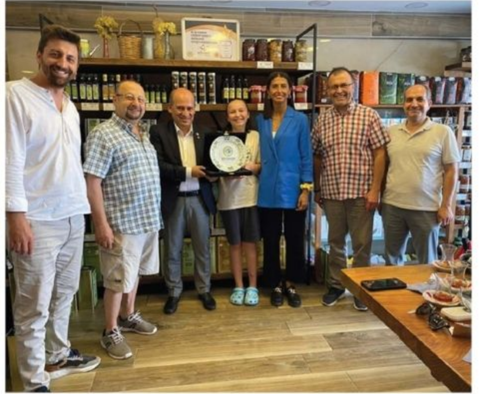
Revna Zeytin Zeytinyağı