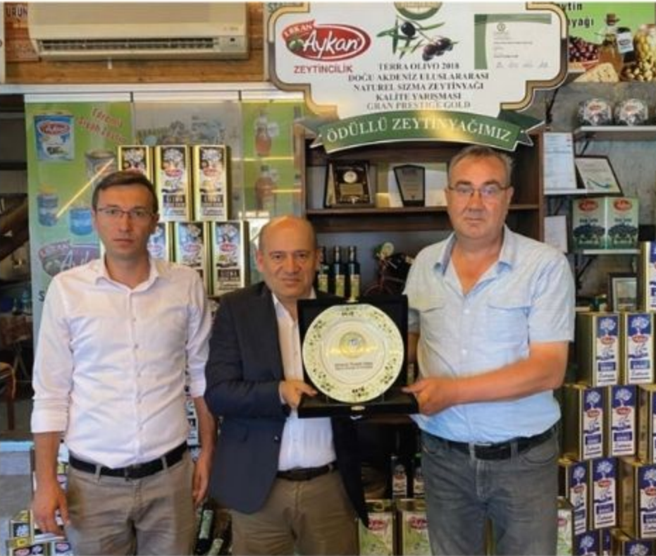
Erkan Aykan Zeytin Zeytinyağı