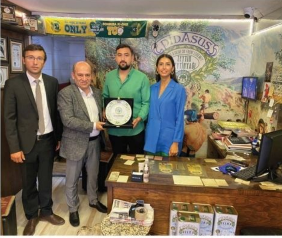
Pidasus Zeytin Zeytinyağı