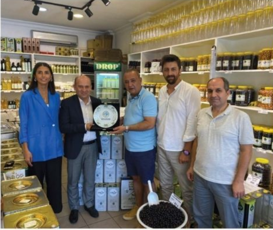
Drop Zeytin Zeytinyağı