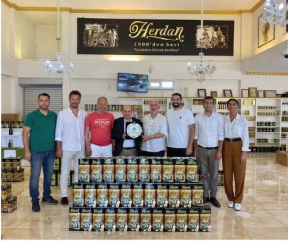
Herdan Zeytin Zeytinyağı