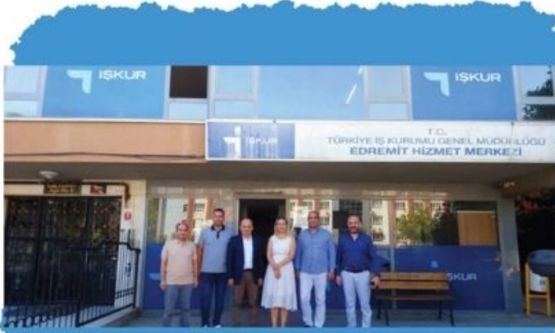
ETO Yönetim Kurulu İŞKUR'u Ziyaret Etti