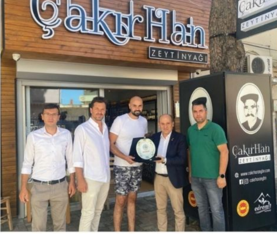
Çakırhan Zeytin Zeytinyağı