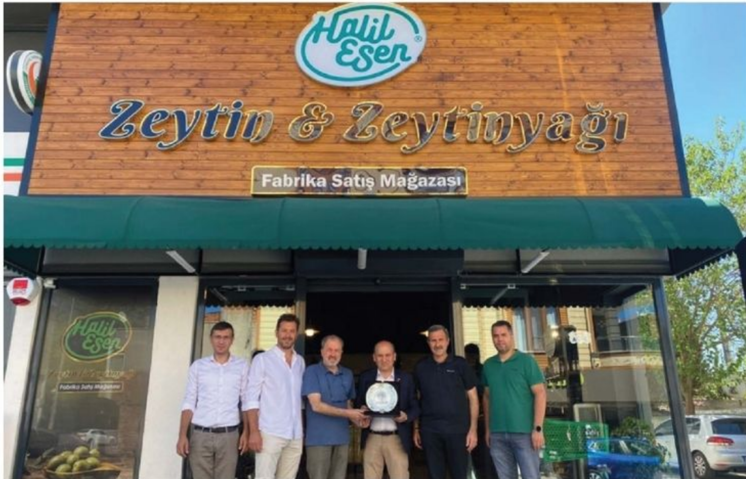
Halil Esen Zeytin Zeytinyağı