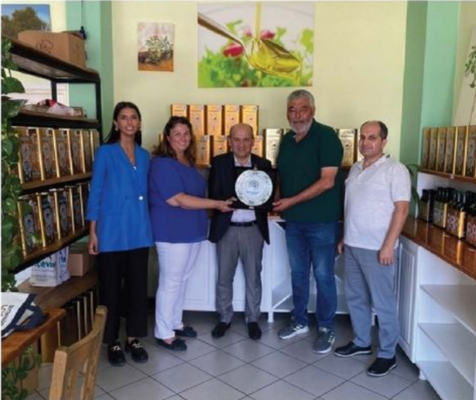
Erçevik Zeytin Zeytinyağı