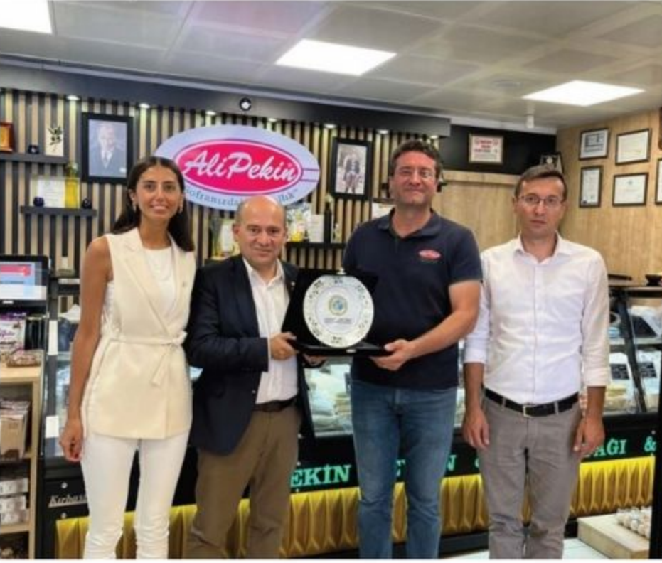
Ali Pekin Zeytin Zeytinyağı