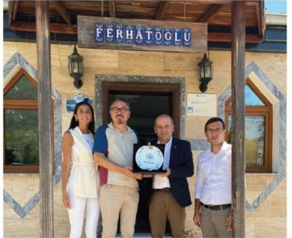
Ferhatoğlu Zeytin Zeytinyağı