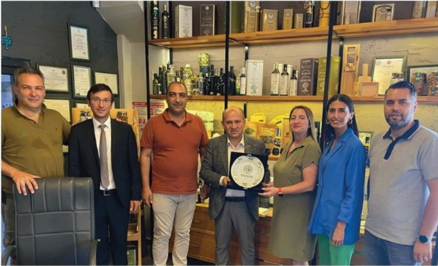
Adalı Efe Zeytin Zeytinyağı