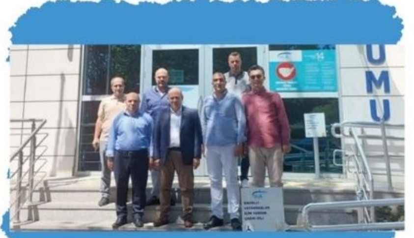
ETO Yönetim Kurulu Edremit SGK Şube Müdürünü Ziyaret Etti