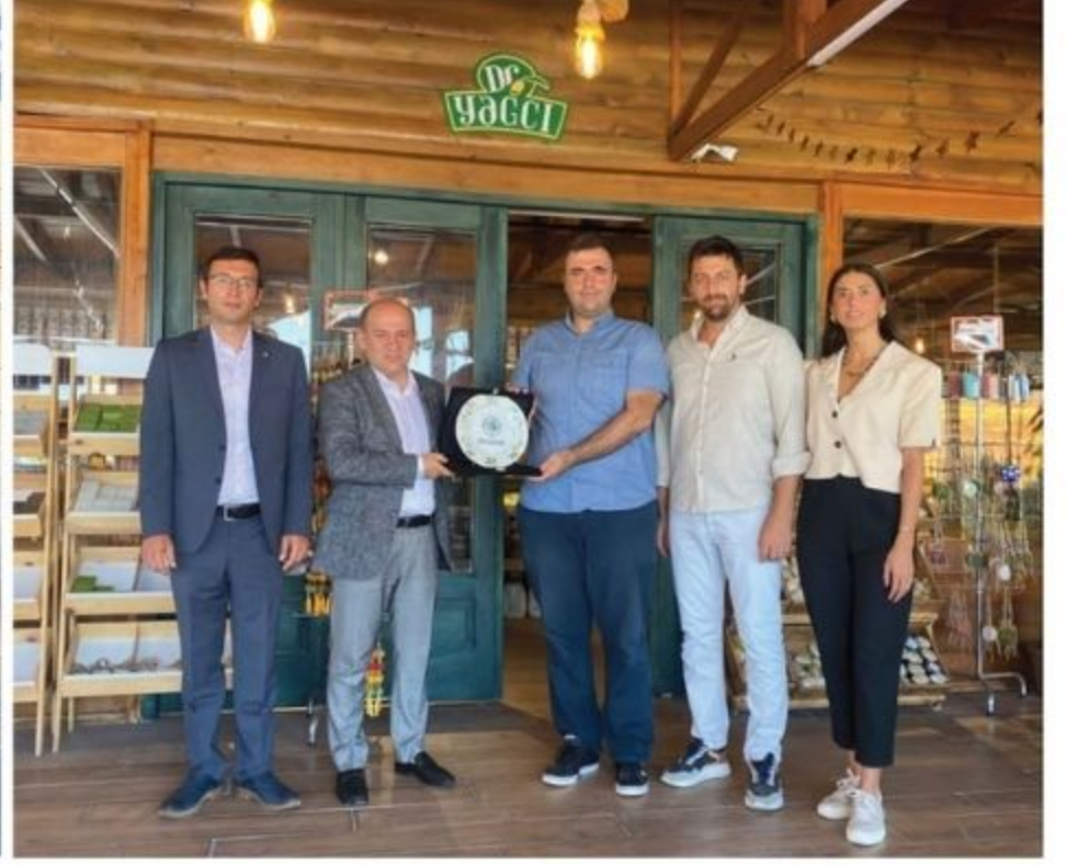
Dr. Yağcı Firma