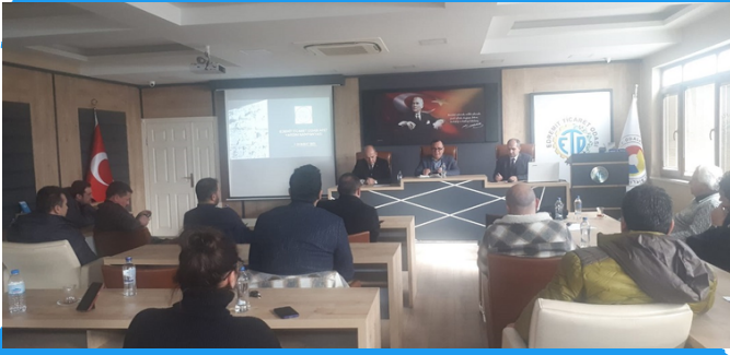
Edremit Ticaret Odası Meclisi Olağanüstü Toplandı