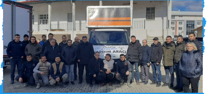
Edremit Ticaret Odası Afet Yardım Kampanyası