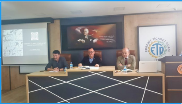
Edremit Ticaret Odası Meslek Komiteleri 21 Şubat 2023 Tarihinde 3 Oturumda Toplandı