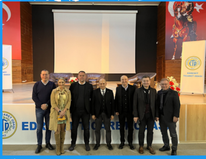
'2023'te Türkiye ve Dünyada Ekonomi' Konulu Panel Düzenledi