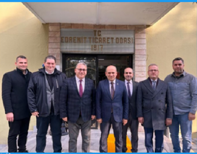
ETO'da KOSGEB Temsilcilik Ofisi Açılıyor