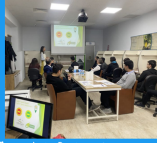
Lise Öğrencileri Zeytinyağı Duyusal Tadım Etkinliğinde