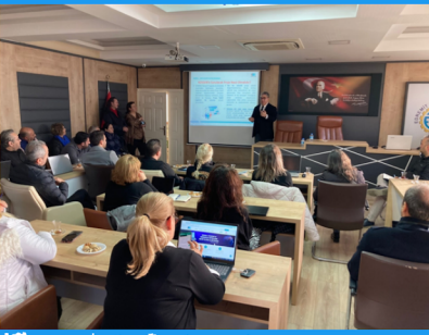
ETO'da KOSGEB Destekleri Bilgilendirme Toplantısı Yapıldı